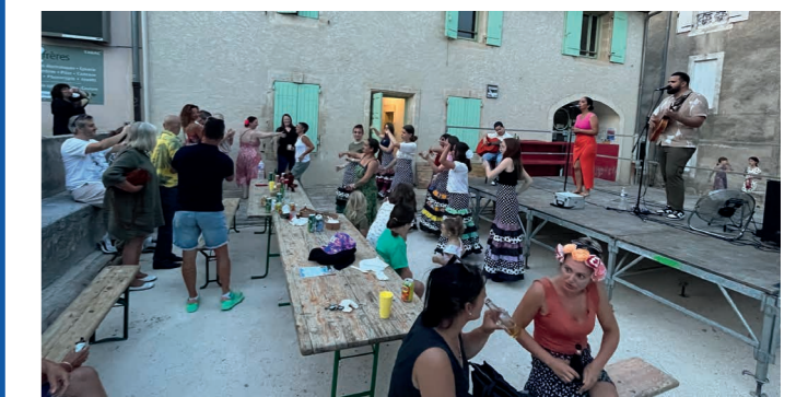
Les Vendredis musicaux.