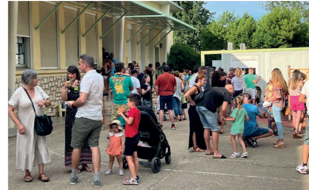
Fête des écoles.