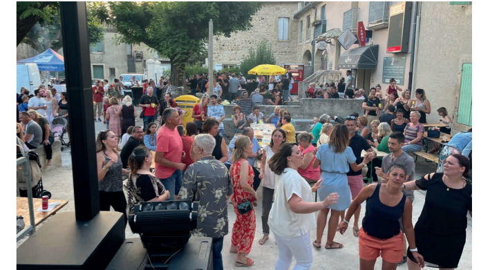
Fête de la musique.

Le CMJ a participé à une bourse aux jouets et à un marché de Noël dans le but de récolter des dons pour les enfants malades.