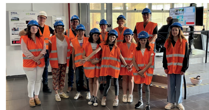
Visite du CMJ à l'incinérateur de Lunel-Viel.